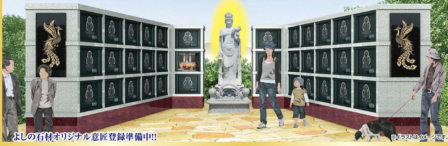
よしの石材オリジナル意匠登録準備中!!