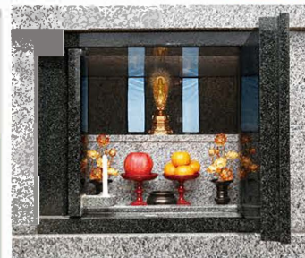
※イラストはイメージです。