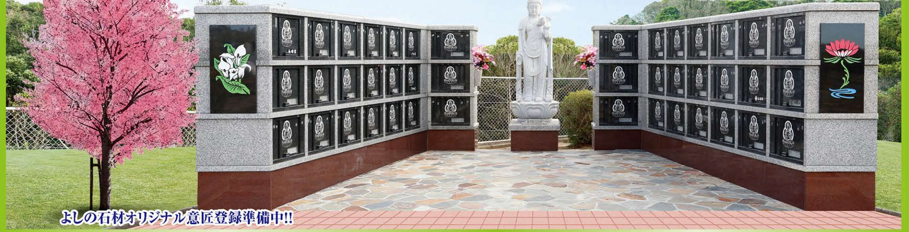
よしの石材オリジナル意匠登録準備中!!